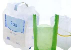
Suremballages, sacs, films en plastique