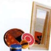
Capsules, bouchons, couvercles. Miroirs.

Un doute ? Jetez dans votre poubelle habituelle