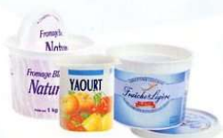
Pots de produits laitiers

Non recyclés : dans ma poubelle habituelle