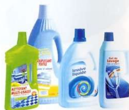
Flacons de produits ménagers...