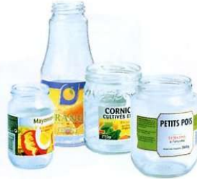
Bocaux de conserve