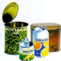
Boîtes de gâteaux, à thé, de conserve... et boîtes de boisson