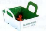
Boîtes en carton salies ou contenant des restes