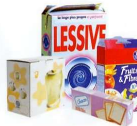
Boîtes et suremballages en carton