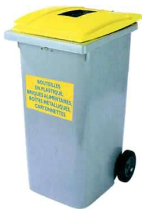
un bac individuel ou collectif

Pour les journaux, magazines, prospectus