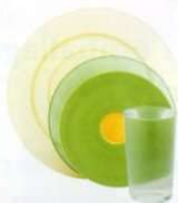
Vaisselle, faïence, porcelaine

Non recyclés : dans ma poubelle habituelle