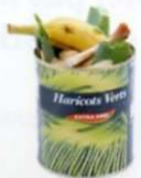
Boîtes contenant des restes

Non recyclés : dans ma poubelle habituelle