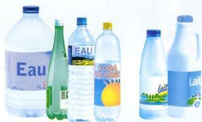
Bouteilles d'eau, de jus de fruit, de soda, de lait, de soupe...

A Recycler : dans le bac à couvercle jaune